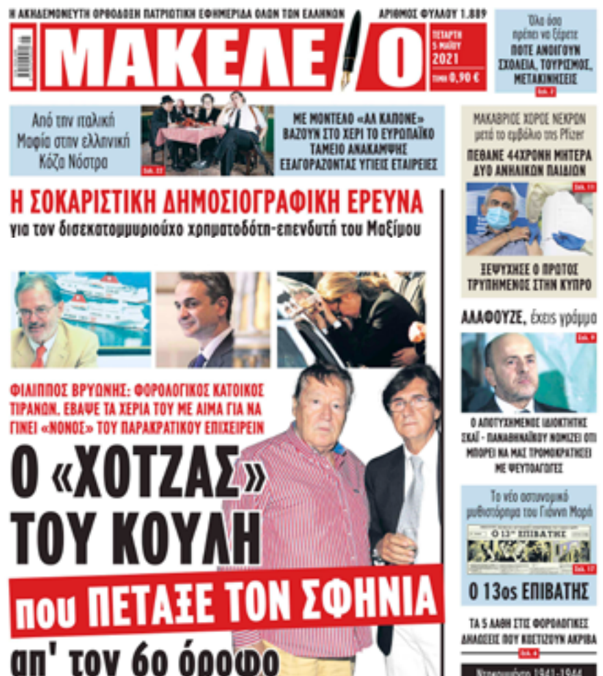
«Εξπρές Σάμινα» του Φιλίππου Βρυωνη ... τραγωδία με 81 νεκρούς !